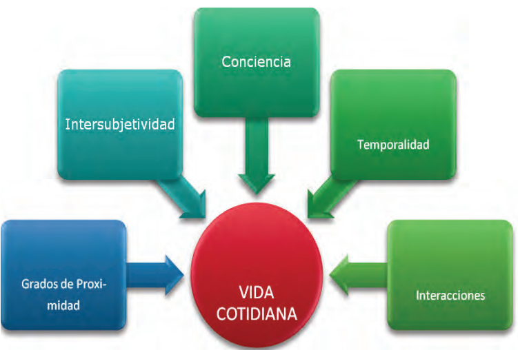
Figura 2. Elementos de la vida cotidiana según Berger y Luckmann (1997)

Situaciones nuevas buscan nuevas explicaciones y esas nuevas explicaciones se conforman a partir de las anteriores, por lo que la vida cotidiana, y el modo en que reaccionamos en ella, es producto de la creatividad de los individuos y de su historicidad. La cultura se crea, recrea y modifica constantemente y todos los seres humanos, con las explicaciones que damos del mundo, estamos creando nueva cultura. La cultura es el acopio o cúmulo social del conocimiento del que ya hablaba en líneas anteriores y se logra en la vida en sociedad.