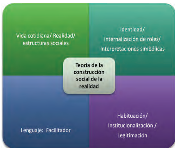
Figura 1. La Teoría de la construcción social de la realidad y sus elementos principales según Berger y Luckmann (1997)

Estos conceptos se hacen evidentes en la vida cotidiana , que es una realidad interpretada por las personas y que para ellos tiene el significado subjetivo de un mundo coherente (Berger y Luckman, 1997). Se estructura en el espacio y en el tiempo y se comparte con otros, a través del lenguaje y de las interacciones. Para Berger y Luckmann (1997), la realidad se origina en las acciones y en los pensamientos de los individuos, por eso se dice que esta construcción es subjetiva y se presenta, elaborada y representada en objetos que son históricamente designados como tales en la sociedad y tienen una permanencia relativa, y los denominan esquemas tipificadores .