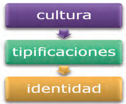
Figura 3. La identidad como producto de la cultura según Berger y Luckmann (1997)

Un individuo no existe en cuanto tal sino hasta que otro se da cuenta que es , que existe y que tiene ciertas pautas de comportamiento y de vida que permiten clasificarlo, etiquetarlo o, en términos de Berger y Luckmann, tipificarlo (Figura 3). El yo se forma entonces a partir de un proceso social en el cual los seres humanos nos constituimos como personas. Este proceso es llamado socialización.