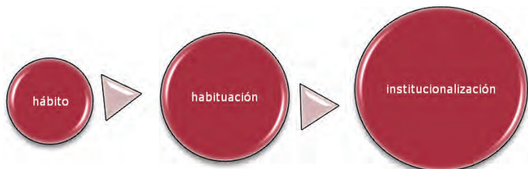
Figura 5. El proceso para llegar a la institucionalización según Berger y Luckmann (1997).

El lenguaje transmite también aquellos consensos que se han convertido en una norma socialmente aceptada, por lo que es el medio para dar a conocer las habituaciones que hay en torno a una realidad construida socialmente y es el elemento necesario para institucionalizar esa realidad (Figura 5). Esos consensos con el acervo del conocimiento que determina los niveles de integración de los individuos, constituyen una dinámica motivadora del comportamiento de las personas y define áreas institucionalizadas en la realidad social designándolas de cierta manera, en base a la habituación que se ha hecho de ellas. En este caso que nos ocupa, el lenguaje es un elemento de análisis en función de los y las jóvenes de secundaria quienes expresan lo que opinan de los derechos humanos.